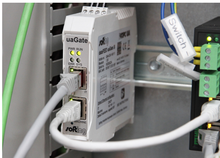
Das Know-how der SEP GROUP und das Gateway uaGate SI von Softing garantierte die reibungslose Digitalisierung des Maschinenparks bei KraussMaffei Technologies

Als weiterführendes Projekt will KraussMaffei Technologies auf Basis der gewonnenen Daten via Condition Monitoring den Maschinenpark zukünftig überwachen, um mögliche Maschinenausfälle frühzeitig zu erkennen.